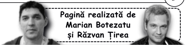
Pagină realizată de Marian Botezatu și Răzvan Țirea

întors cu spatele și au făcut semne obscene. Chiar dacă turneul final a fost găzduit de Ungaria, Federația Europeană de Handbal s-a autosesizat și a inițiat o procedură împotriva forului vecin. Imediat după partida respectivă, mai multe personalități din viața publică au luat poziție, iar unele scrisori au ajuns și la EHF. La aproximativ 3 luni distanță de la respectivele incidente, Curtea EHF a anunțat și verdictul: «Comportamentele inadecvate de tipul celor afișate de spectatorii din Ungaria în timpul meciului nu trebuie tolerate în sportul nostru și trebuie implementată o politică de toleranță zero față de ele», se specifică într-un comunicat, în care a fost făcută publică și sentința: 5.000 de euro amendă și avertisment. În cazul în care suporterii maghiari vor recidiva, atunci Ungaria riscă să joace o serie de meciuri fără spectatori.