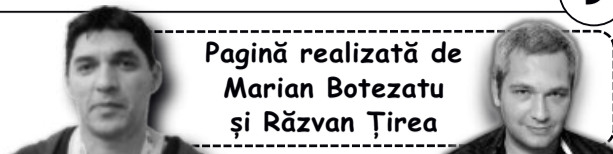
Pagină realizată de Marian Botezatu și Răzvan Țirea

Liga 1, liga insolvenților! FC Brașov este al nouălea club de Liga I care solicită intrarea în insolvență în ultimii doi ani, după FC Rapid, Gloria Bistrița, Universitatea Cluj, Oțelul Galați, FC Vaslui, FC Dinamo, CFR Cluj și Petrolul Ploiești. Dintre acestea, doar șapte mai activează în prezent în primul eșalon, Gloria Bistrița și FC Vaslui fiind dezafiliate de Federația Română de Fotbal. Formația FC Brașov ocupă în prezent poziția a unsprezecea în clasamentul Ligii I, cu 20 puncte.