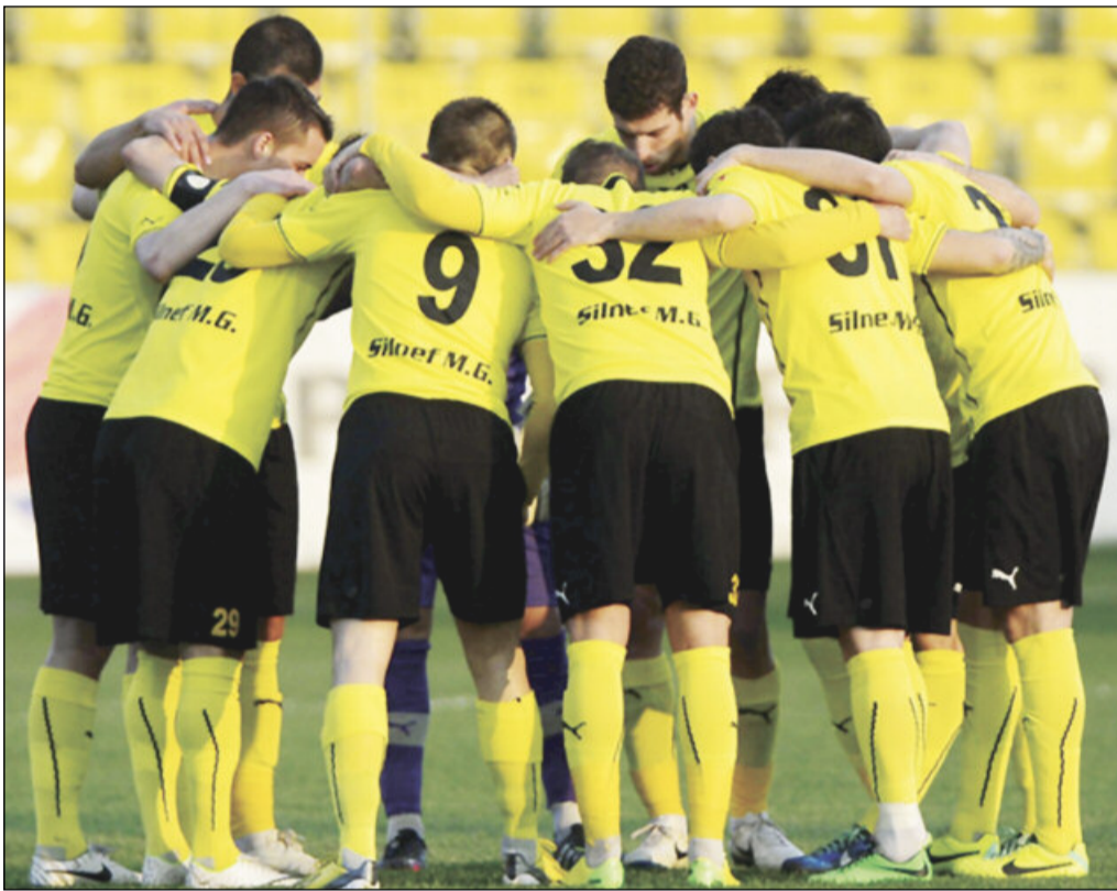
Insolvența nu iartă: și-a întins aripile și deasupra Brașovului!