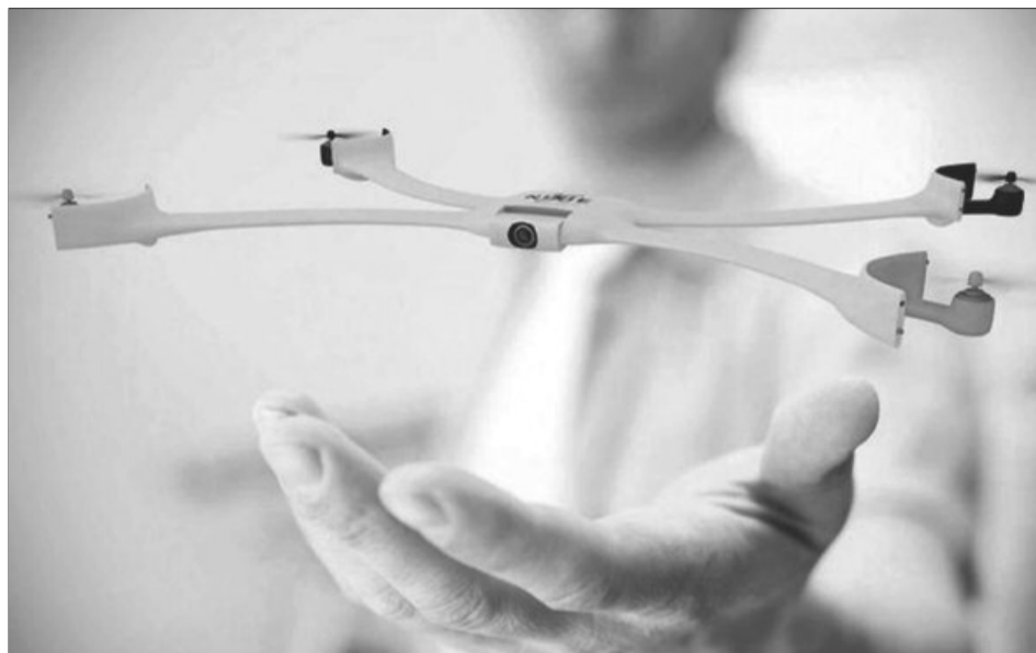
Prototipul se află în fază inițială și nu are încă data de lansare pe piață

Prototipul, pus la punct de o echipă de experți din SUA și Germania, se adresează îndeosebi amatorilor de ascensiuni montane sau ciclism, care își vor putea immortaliza aventurile cu această „dronă portabilă”. Proiectul se află în faza inițială și nu are încă data de lansare pe piață. Christopher Kohstall, șeful echipei care a dezvoltat prototipul, a explicat în videoclipul prezentat în concurs că Nixie știe unde se află proprietarul și se întoarce la locul de plecare. Posesorul aparatului poate și să prindă ca-