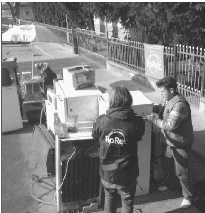
Nu mai este nevoie să așteptați o zi specială pentru a scăpa de aparatura veche

„Agenții vin la casa omului și duc deșeurile electrice în centrul de reciclare. Toți cei care pot să devină parteneri ai proiectului