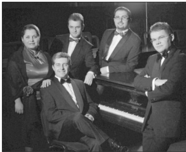
Cvintetul vocal Anatoly

Evenimentul organizat cu o zi înaintea Sărbătorii Sfinților Arhangheli Mihail și Gavriil își propune strângerea de