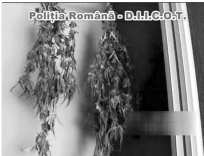
În locuințele indivizilor au fost descoperite culturi de cannabis

În urma administrării probatorului, procurorii DIICOT