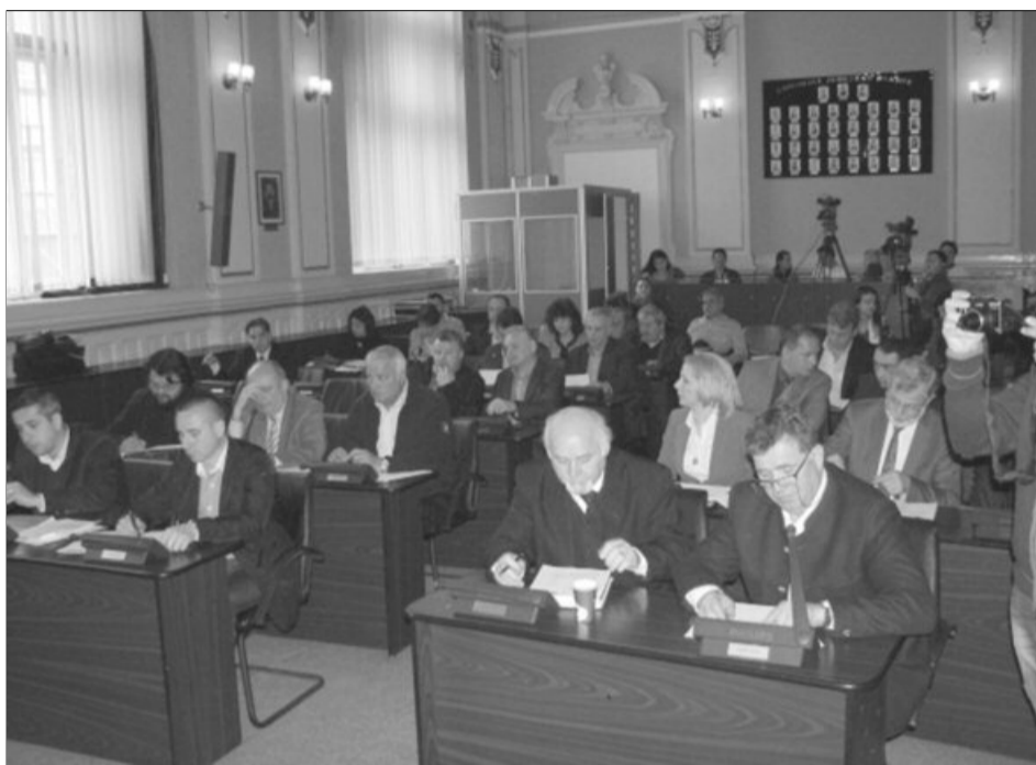
Investițiile în spitalele județene, o prioritate pentru consilierii județeni

Astfel, la Spitalul Județean Brașov s-au alocat 72.000 de lei pentru o lampă scilicatică necesară blocului operator (e vorba de sistemul de iluminat amplasat deasupra mesei de operații), 39.000 pentru un videocoloscop, 61.000 de lei pentru un set motor chirurgie-ortopedie, 39.000 de lei pentru repararea videogastroscopei și 100.000 de lei pentru finanțarea primei etape