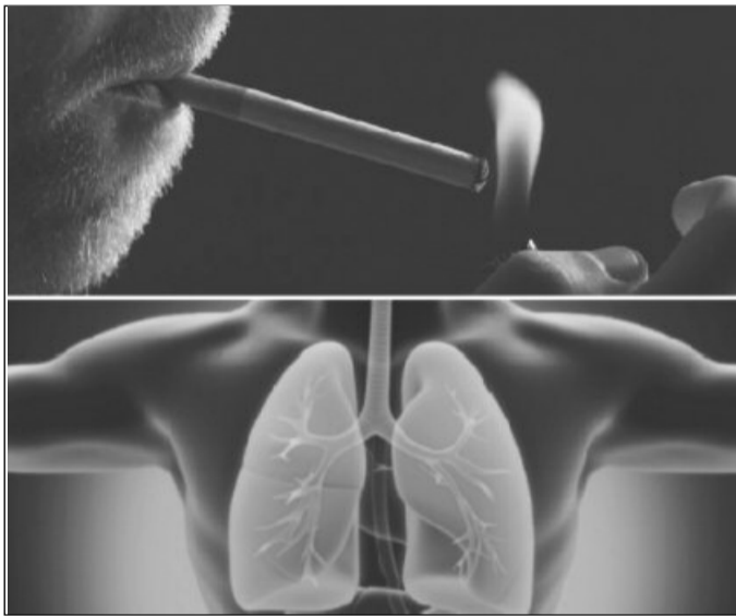
Fumatul ucide anual aproximativ 6 milioane de persoane

Bea în fiecare zi două căni dintr-un ceai depurativ, preparat de farmacist. Amestecul