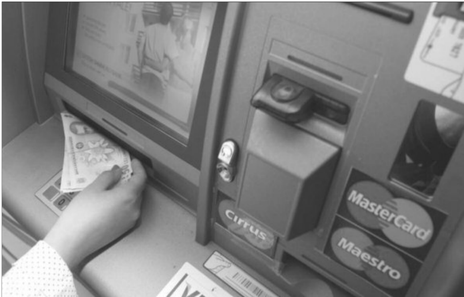
Tranzacțiile la bancomat prin afișarea comisioanelor devin mai transparente

La acea dată, bancherii au avertizat că proiectul de ordin nu poate fi aplicat în forma