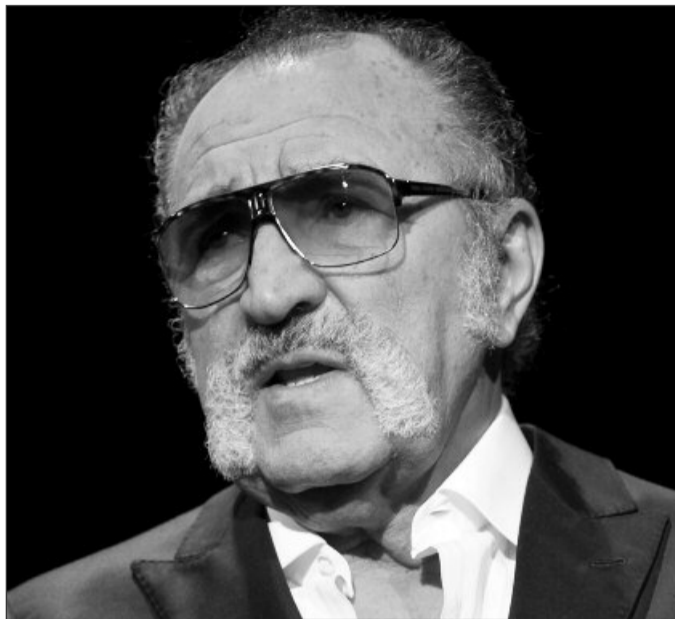
Brașoveanul Ion Țiriac are cea mai mare avere din România

averea cumulată a celor 300 de milionari scădea de la an la an, în 2014 aceasta a crescut cu peste 4% față de ediția anterioară a clasamentului. Astfel, averea totală în acest an a ajuns la 22,47 miliarde de euro, cu aproape un miliard de euro mai mult față de anul 2013, ceea ce reprezintă aproximativ 16% din Produ-