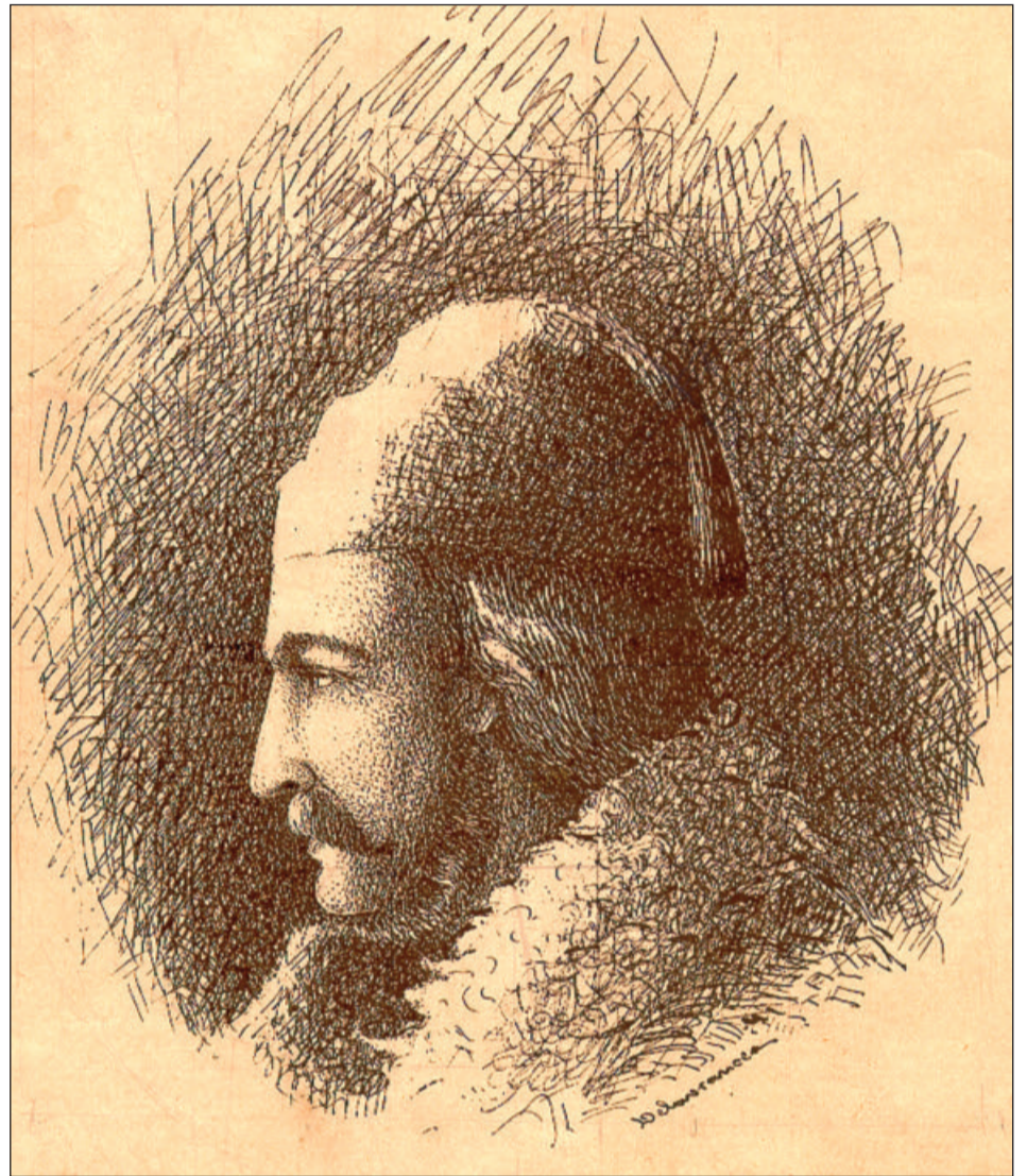
Anton Pann – gravura lui Barbu Șefănescu Delavrancea aflată în sala de clasă

Faptul că actul de apartenență al cărții este consemnat chiar de Anton Pann, poate convinge că s-a ocupat și de organizarea bogatului fond