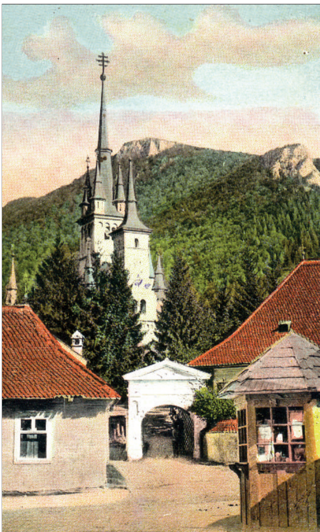
Biserica Sf. Nicolae a fost strâns legată de prezența lui Anton Pann la Brașov