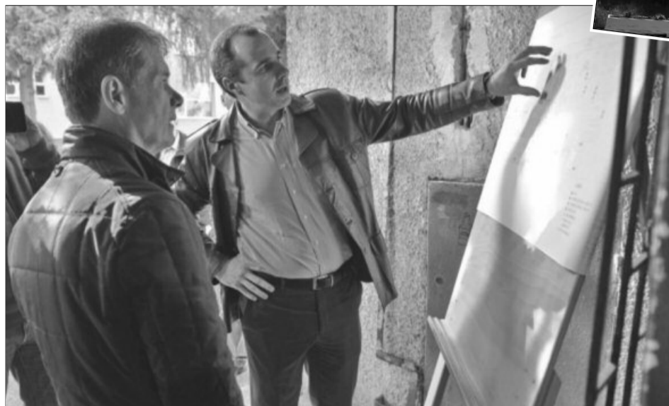
Primăria Brașov va executa lucrările de reabilitare, iar firmele private le vor dota cu echipamente necesare

„Această investiție este finanțată de la bugetul local și va fi finalizată până în primăvară. Ne-am dorit ca Școala profesională Kronstadt să fie o școală