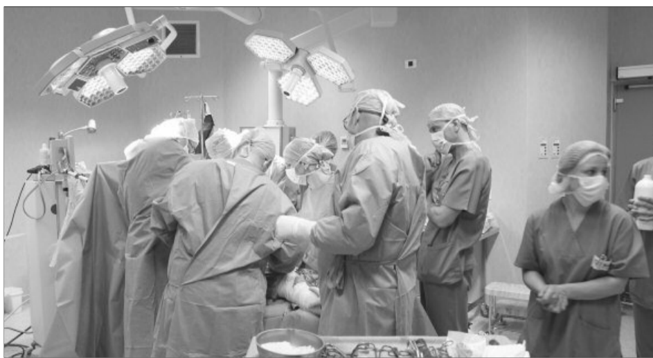
Serviciile medicale ieftine pot aduce în România 500.000 turiști străini în 2015, dublu față de 2014

Turiștii străini vin mai ales pentru tratamente dentare sau chirurgie plastică, notează Bloomberg.