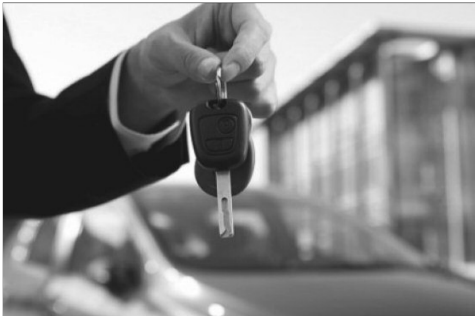
Toți cei care au peste 18 ani ar putea să acceseze „Prima Mașină”

nele fizice vor beneficia de o finanțare - exclusiv dobânzile și comisioanele bancare și alte sume datorate de beneficiar în baza contractului de credit - care va acoperi maximum 95% din prețul de achiziție prevăzut în factura proforma. Statul va garanta 50% din finanțarea acordată.