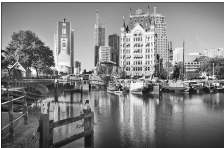
Rotterdam este cel mai mare port fluvial din Europa și al treilea port din lume

„Rotterdamul are o populație tânără, deschisă și tolerantă, adoptă inovații urbane și arhitecturale și se află în avangardă în termeni de antreprenariat. Strategia sa vizează reunirea familiilor și a întreprinderilor în partea centrală a orașului prin interme-