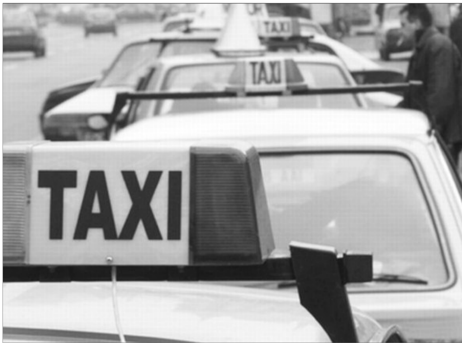
Până la acest moment, tariful practicat de majoritatea taximetriștilor din Brașov era de 1,33 - 1,35 lei/km

„Conform prevederilor legale, Municipicalitatea avizează tarifele cu care circulă taximetriștii autorizați în Brașov, în limita prețului maximal aprobat de Consiliul Local Brașov, preț maximal care este de 2,2 lei/kilometru. În ultima perioadă, am primit o serie de solicitări de la persoane fizice autorizate, întreprinderi familiale și de la trei mari companii dispecerizate, pentru avizarea unui nou tarif de zi, respectiv de 1,53 lei/km, și introducerea unui tarif de noapte, care este