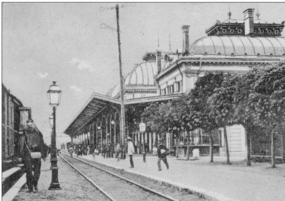
Ploiești – Gara de sud

Cineva care avea biletul în buzunar, ese liniștit din restaurant și coboară scările tunelului, pentru a se duce pe linia a II-a, de unde urma să ia trenul, care trebuia să plece spre Predeal, după cum anunțase portarul cu glasul de stentor.