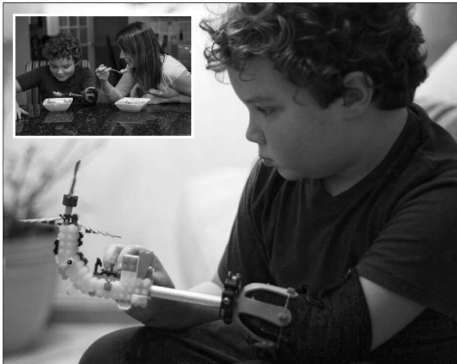
Marea calitate a protezei creată de băiețel constă în flexibilitatea ei

Marea calitate a protezei constă în flexibilitatea ei. Ea