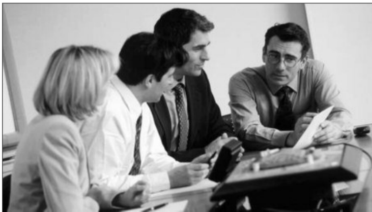
Antreprenorii îi oferă Guvernului soluții pentru creșterea economiei

Reprezentanții antreprenorilor consideră că pentru 2015 sunt foarte importante menținerea cotei unice și a CAS redus, renunțarea la „unele pomeni electorale”, precum creșterea salariilor bugetare, care ar fi nesustenabilă.