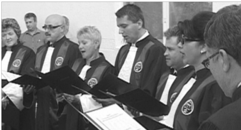
Primul Tribunalul de Arbitraj Instituționalizat a fost înființat în Dâmbovița