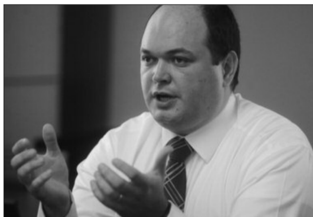
Președintele Consiliului Fiscal, Ionuț Dumitru

„Pe partea de venituri avem colectări de bugete foarte mici, în comparație cu media europeană. Nu am colectat mai mult de nivelul de 27 - 29% din PIB, indiferent de conjunctura economică. Pe cotele de impozitare vedem un sistem de impozitare foarte dezechilibrat, din motive demografice, din cauza disproporției dintre forța de muncă și numărul mare al asistenței sociale. România are