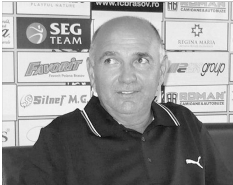
Tehnicianul stegarilor este convins că punctele vor rămâne astăzi la Brașov

Galben-negrii spun că au nevoie foarte mare de cele trei puncte puse la bătaie în jocul de astăzi, și vor face tot posibilul ca acestea să rămână sub Tâmpa. „Avem nevoie de cele 3 puncte, mai mult ca niciodată. Am face o diferență între noi și ei, iar cele două săptămâni de pauză care vor urma le vom putea pregăti mult mai liniștiți. Am pregătit meciul doar cu gândul la victorie și vom obține cele trei puncte. Puțin contează pentru noi ce se întâmplă la Iași, trebuie să ne facem treaba și să