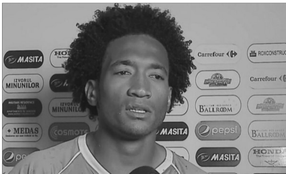
Fotbalistul Concordiei a fost victima unui atac rasist din partea unui membru al galeriei Rapidului

La finalul partidei, fotbalistul Concordiei, a comentat momentul incidentului. „Normal că mă afectează. Soția și copilul meu au fost în tribună. E păcat, este incredibil ce s-a întâmplat. Niște, nici nu știu cum să-i numesc, să facă așa ceva. Am vrut să ies de pe teren, tot eu am primit galben după toate astea. Eu am venit în România, am învățat românește, respect pe toată lumea, dar eu nu sunt respectat. Ce am simțit azi este ceva incredibil, sunt foarte supărat. Nu te poți concentra când îți se strigă ca ești maimuță. Niciodată în viața mea nu mi-am dorit mai mult ca în seara aceasta să dau un gol. Federația sau nu știu cine ar trebui să facă ceva, nu se poate așa ceva. E prima oară în viața mea când mi se întâmplă așa ceva. Justiția trebuie să facă ceva. Copilul m-a întrebat ce s-a întâmplat, de ce s-a aruncat cu o banană în mine. Nu sunt la grădina zoologică”, a spus fotbalistul Concordiei.