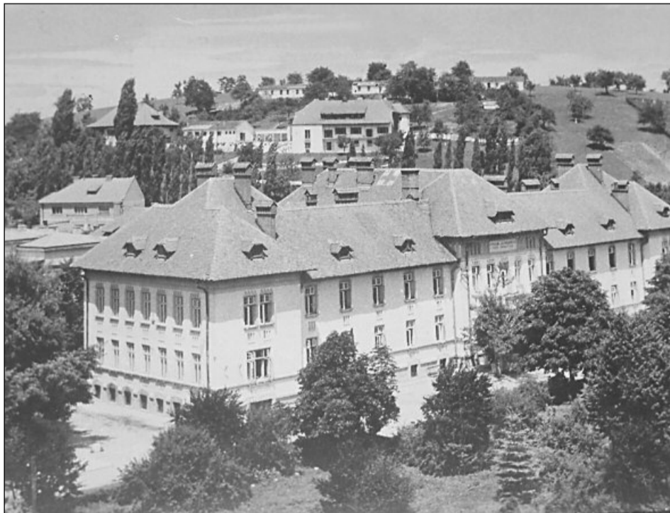
Spitalul Mârzescu

Am făcut o vizită la Spitalul de boli sociale din Brașov, spital adăpostit în vechea clădire a așezămintelor „Mârzescu”, situat în strada Șirul Gh. Dima nr. 1.