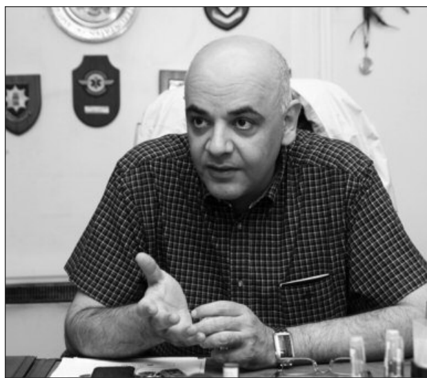
Raed Arafat asigură că România e pregătită pentru apariția unui caz de boală

„Vreau să transmit că, în România, la acest moment, nu avem motiv de panică și acest lucru a fost insistent subliniat la nivelul întrunirii ministeriale, care a fost la Comisia Europeană. Nu se pune problema să se izoleze țările africane sau să se închidă granițele, ar duce la agravarea situației, mai mult decât la îmbunătățirea ei. S-a discutat mult de screeningul la intrare în Europa, unde să se facă screeningul că dacă cineva este îmbolnăvit, totuși, să prindem situația de la început și să fie izolat. Concluzia a fost că screeningul, cel mai bine, este să fie făcut la ieșire din țările africane afectate, urmând ca ONS și Comisia Europeană să auditeze aeroporturile de la care se pleacă, să fie convinși că screeningul,