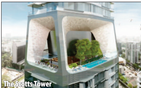
The Scotts Tower

sub formă de spirală, propune oaspeților o piscină cu fundul