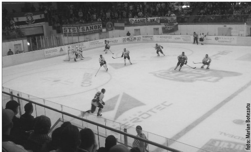
„Lupii” de la Corona au fost foarte aproape de turul 3 al Cupei Continentale!

Toate cele trei goluri ale noastre s-au marcat în mai pu-