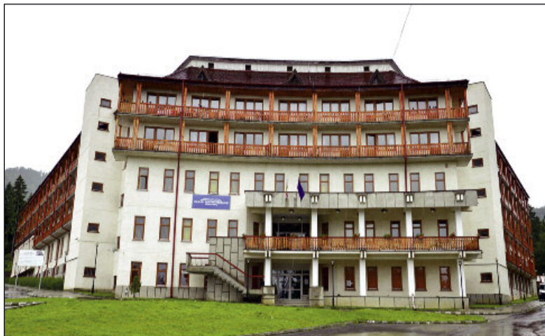
Căminul de bătrâni din Noua

anchetelor sociale pentru dosarele acestora. Direcția de Servicii Sociale a Primăriei desfășoară aceste anchete în baza celor aproximativ 50 de solicitări primite. Centrul va avea o capacitate maximă de 40 de locuri. Contribuția zilnică pe care o parte dintre viitorii beneficiari ai Centrului de zi Respiro o vor avea de plătit pentru serviciile acor-