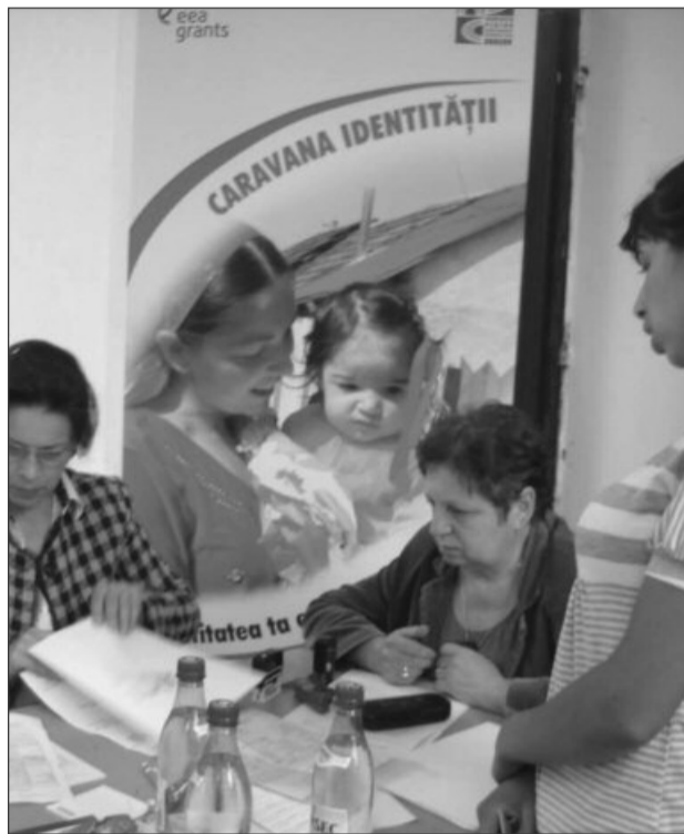
Persoanele de etnie romă vor primi sprijin să-și facă acte de identitate

Acțiunea se adresează persoanelor de etnie romă din comuna Comăna. Sprijinul va fi acordat prin suportarea contravalorii emiterii cărții de identitate, în caz de expirare și/sau preschimbare, schimbarea domiciliului, pierderea documentului de identitate sau în momentul împlinirii vârstei de 14 ani. În cazul în care se vor regăsi persoane identificate în situația de a nu avea acte de stare civilă sau de identitate și care sunt nedepășabile, aceștia vor