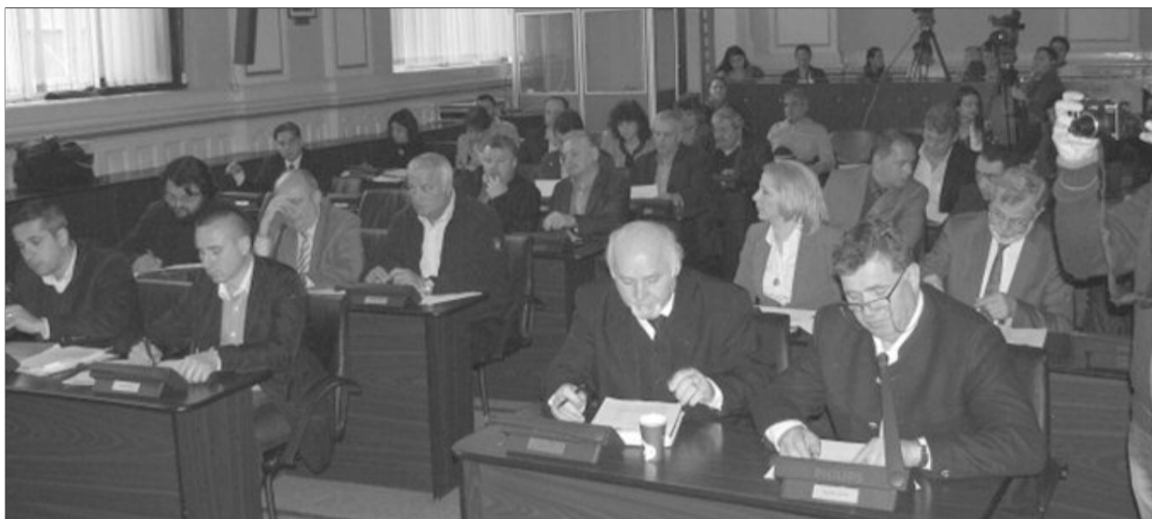
Consilierii județeni au votat aprobarea bugetelor pentru Centrele Școlare pentru Educație Incluzivă din Victoria și Făgăraș

„Aveam probleme în special cu bugetarea școlilor speciale