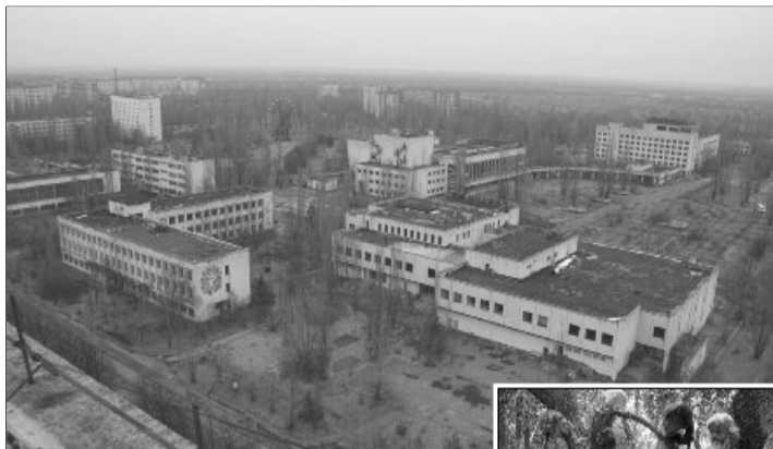
Orașul fantomă și pădurea păpușilor

Tuol Sleng – Muzeul genocidului din Cambodgia. Lăzi pline cu oase umane și o masă de tortură se află printre exponatele înspăimântătoare de la fosta Închisoare 21 din Phnom Penh. Colecțiile de aici reprezintă un omagiu adus celor 17.000 de oameni închiși în timpul regimului terorii condus de khmerii roșii (1975 – 1979). După ce erau interogați și torturați, mulți prizonieri erau apoi duși la centrul de exterminare Choeng Ek. Imaginile alb-