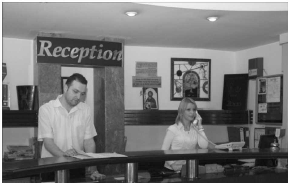
Turiștii sunt atrași la munte cu condiții ieftine de cazare

„Programul își propune să promoveze turismul montan, asigurând accesul la odihnă, la tarife speciale, unui număr cât mai mare de turiști români. Tarifele practicate în cadrul acestui program special de către hotelurile de la munte vor fi neschimbate față de anii trecuți. Aceste tarife sunt cu până la 50% mai mici față de