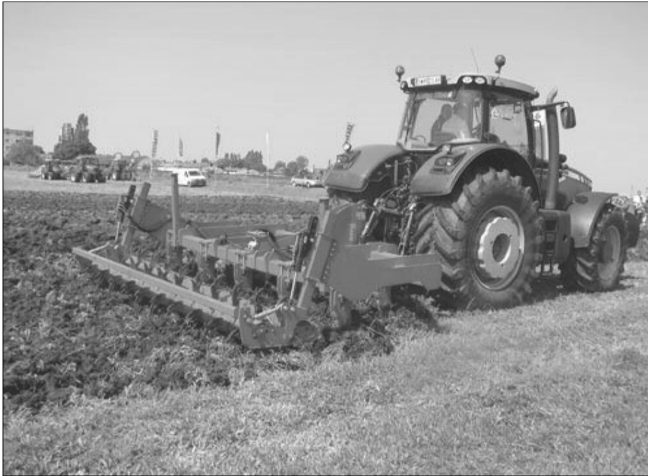
Potențialul de creștere a producției în agricultura românească este foarte mare, spun investitorii străini

Potrivit datelor furnizate de firma britanică Savills Plc, în 2012 un hectar de teren arabil în România costa, în medie, 6.461 de dolari, comparativ cu 18.521 de dolari în Germania și 25.575 de dolari în Marea Britanie. Problema este suprafața mică a exploatațiilor agricole din România, 3,4 hectare în medie