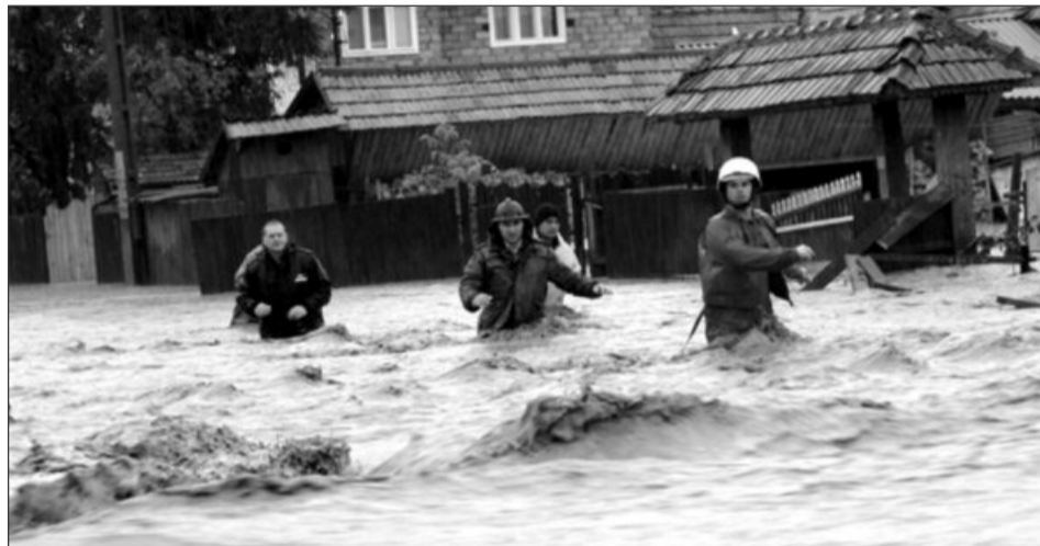
Conform bilanțului provizoriu, inundațiile au afectat trei județe din zona Banat

Potrivit ministrului Afacerilor Interne, Gabriel Oprea, luni au acționat în zonele afectate de inundații 200 de pompieri, polițiști, jandarmi și polițiști de frontieră, fiind totodată constituită o rezervă de peste 250 de oameni gata