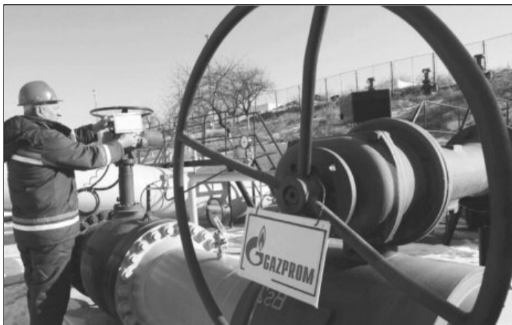
Populația României nu va fi afectată de reducerea importurilor de gaze, asigură autoritățile

Potrivit HotNews, Nicolescu a mai afirmat că Transgaz, compania națională de transport, nu a primit nicio explicație din partea Gazprom. „Am încercat să discut astăzi (n.r. luni) cu ambasadorul Rusiei la București și mi s-a comunicat că nu este în București. Am vrut să înțeleg motivele