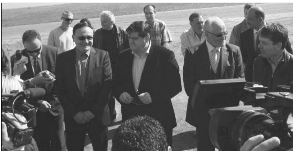
Finalizarea Aeroportului Internațional de la Ghimbav are sprijin total din partea politicianilor brașoveni

ghita. În prezent, suprafața de 210 hectare alocată aeroportului este împrejmuțată și viabilizată. Construcția pistei de decolare aterizare a aeroportului având dimensiunile de 2820 x 45m, cu acostamente de 7,5m pe ambele laturi și PCN 80 R/D/W/T se încheie pe data de 30.09.2014. Pentru realizarea căii de rulare Alfa, a platformei de parcare aeronave având 17.500 mp, precum și a canalizării aferente tuturor acestor suprafețe de mișcare C.J.Brașov a inițiat procedura de achiziție, urmând ca firma câștigătoare să fie comunicată până la sfârșitul lunii septembrie. Lucrările de canalizare a apelor pluviale, cel puțin pentru pista de decolare aterizare, se vor efectua în această toam-