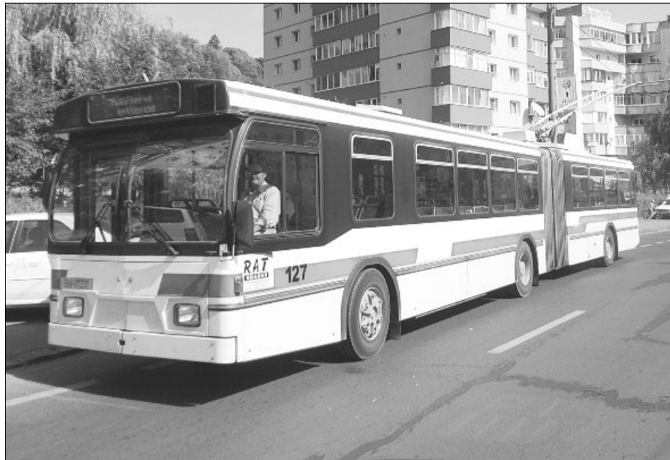
Pe străzile Brașovului vor circula începând de astăzi cele zece troleibuze

În cele 10 autovehicule sunt amplasate aeroterme electrice, pentru a asigura o tempe-