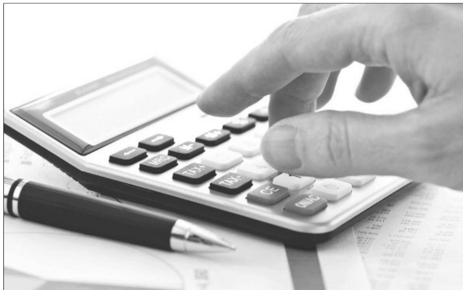
Taxele locale în municipiul Brașov nu au mai crescut în ultimii ani

La Brașov, contribuabilii care și-au plătit aceste impozite pentru întreg anul până la primul termen de plată au beneficiat de o scutire de 5%, indiferent că a