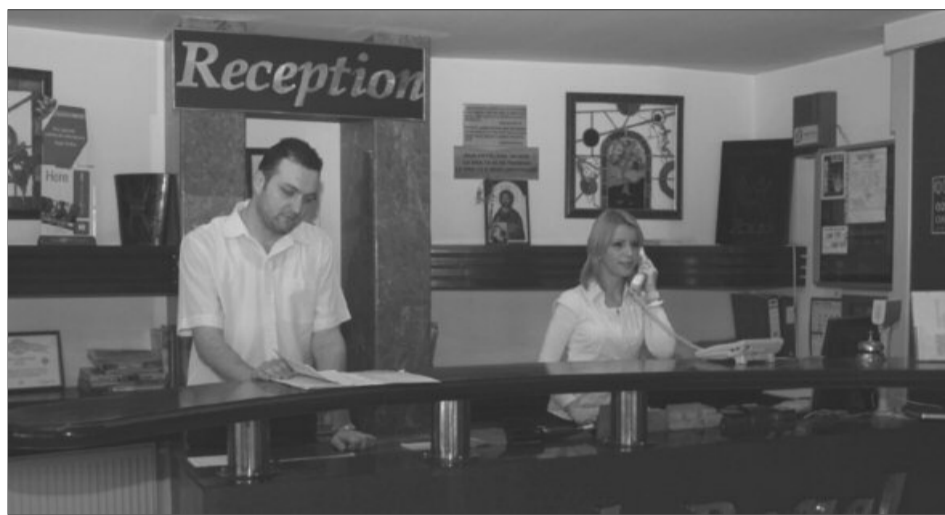
Patronatele de turism propun soluții pentru îmbunătățirea serviciilor oferite de români în acest domeniu

Șefa patronatului din turism menționează că fiscalitatea afectează atât prețul final pentru turist, cât și dorința investitorului de a mai investi în turism. Pe de altă parte, președintele ANAT estimează că nivelul evaziunii fiscale este de 40% în sectorul de turism. Cei mai mulți străini călătoresc în România în interes de afaceri și provin, majoritar, din țările membre ale Uniunii Europene.