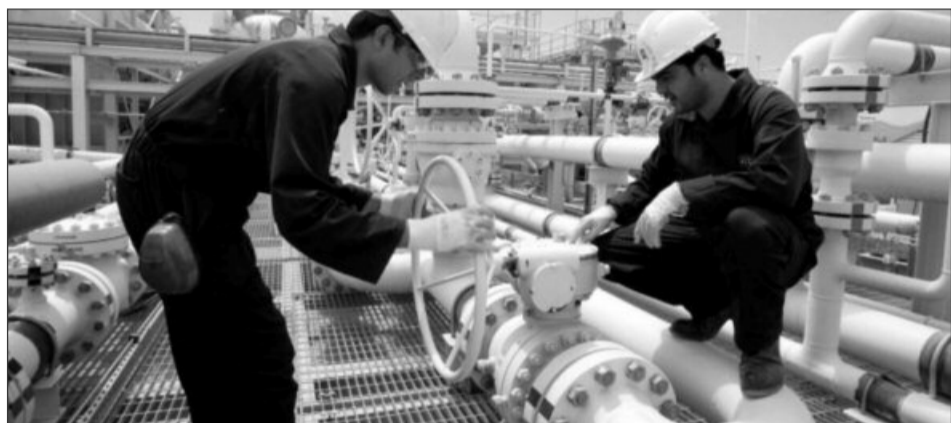
FMI și Comisia Europeană au fost de acord cu amânarea liberalizării prețului gazelor

La începutul acestei luni, ministrul delegat pentru Energie a declarat că va propune autorităților de la Bruxelles ca prețul gazelor interne pentru populație să nu mai crească până