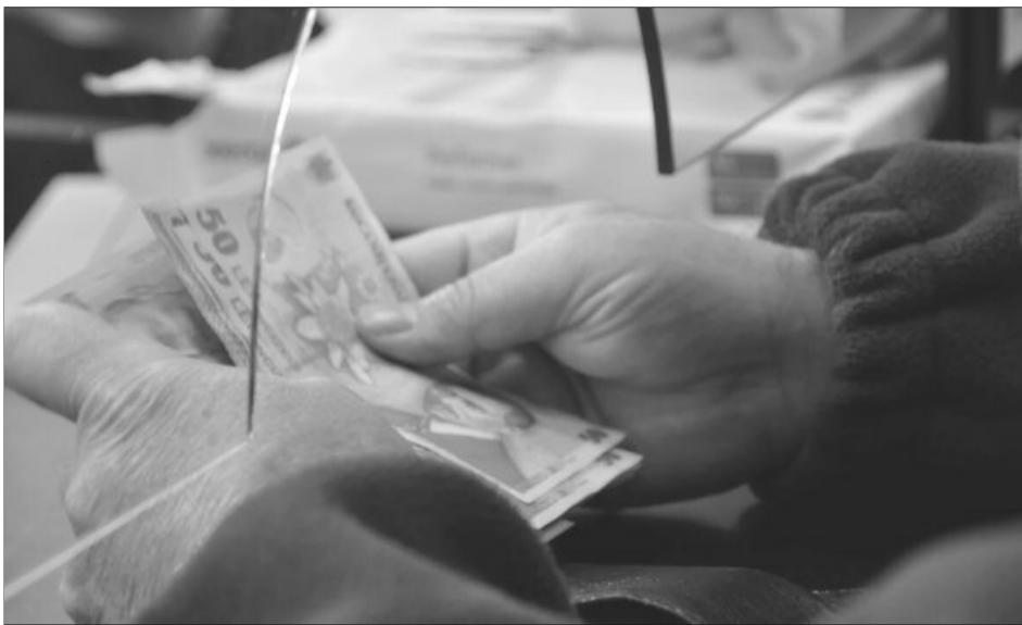
0 treime dintre români își achită cu greu facturile la timp

Conform acestui studiu, procentul de facturi achitate la timp de către românii persoane fizice este mai mic decât media est-europeană, de 72%, și cu mult mai mic decât media paneuropeană, care este de 75%. „Persoanele fizice au la dispoziție un termen