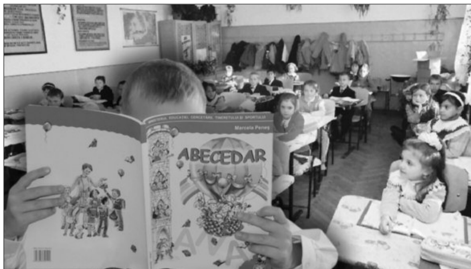
Din cauza licitațiilor contestate, copiii din clasa întâia încă nu au abecedare noi

Potrivit MEN, reevaluarea făcută de Centrul Național de Evaluare și Examinare (CNEE) s-a realizat în baza legislației în vigoare privind licitațiile publice. Termenul de finalizare a reevaluării a fost stabilit în maximum două săptămâni de la momentul publicării deciziei. Reevaluarea, subliniază ministerul, este prima etapă din procedura de