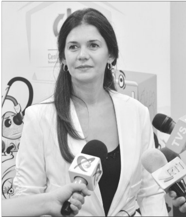
Reprezentanții RoRec au anunțat lansarea noii campanii

RoRec și Primăria Brașov vor organiza din nou cele 14 puncte de colectare devenite deja obișnuite, iar voluntarii din cadrul campaniei vor prelua echipamentele de mari dimensiuni (frigidere și mașini de spălat), în mod gratuit. Ba mai mult, organizatorii campaniei vor oferi tuturor celor care vor scăpa de astfel de echipamente câte un cupon cadou în valoare de 40