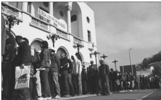
Brașovenii vor avea la dispoziție peste 750 de locuri de muncă

Meseriile cu un număr mai mare de locuri vacante pentru studii superioare sunt: inginer (diverse specializări), funcționar administrativ domeniul telecomunicații, programator, administrator rețea, consilier juridic, controlor calitate, responsabil achiziții logistică, referent specialitate marketing, coordonator vânzări, șef laborator, specialist ofertare li-