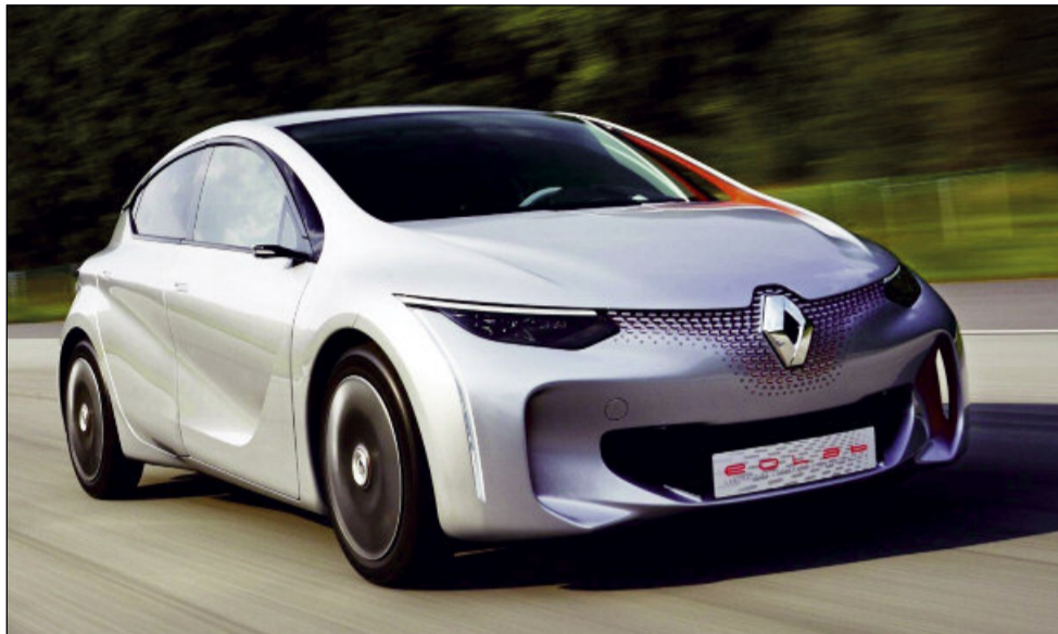
Constructorul de automobile Renault va prezenta la Salonul Auto de la Paris conceptul Renault Eolab – mașina care consumă 1l/100 km.

Francezii vor să concureze astfel cu performanțele celor de la Volkswagen care vând din 2013 modelul XL1, cu un consum similar.