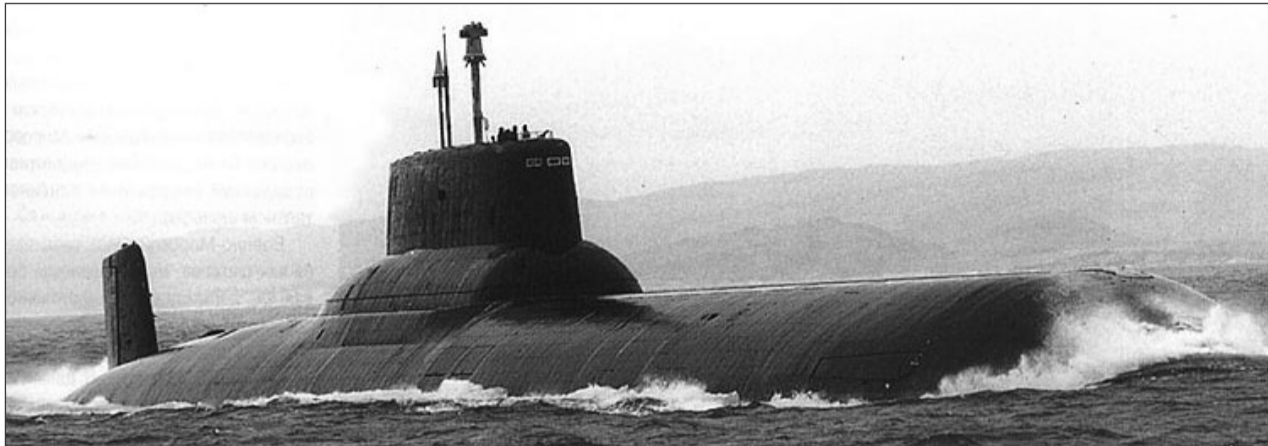
Submarinele rusești din Marea Neagră vor avea rachete care pot ajunge până la București sau Kiev

Submarinele staționate la Baza de la Novorosiisk a Flotei ruse de la Marea Neagră vor fi echipate cu rachete de croazieră având raza de acțiune de peste 1.500 de kilometri, a declarat comandantul Flotei, Aleksandr Vitko, potrivit Itar-Tass, anunțată Mediafax