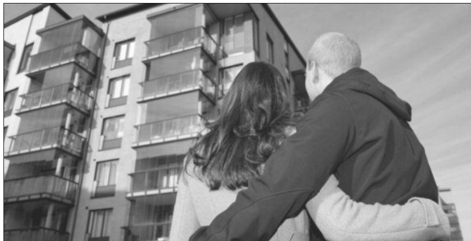
Sumele nefolosite de ANL pentru Prima Casă vor fi realocate pentru toate tipurile de locuințe

„Imediat după publicarea Hotărârii de Guvern în Monitorul Oficial, sumele neutilizate din plafonul total de 500.000.000 lei destinat inițial achiziționării locuințelor construite de ANL vor putea fi utilizate ca plafon general de garantare pentru achiziționarea tuturor tipurilor de locuințe. Analizele făcute pe baza actualului nivel al cererii și estimările partenerilor noștri bancari ne indică faptul că bugetul total neutilizat de circa 710 milioane lei, buget ce include și plafonul realocat, va fi suficient pentru