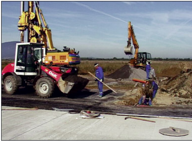
Pista aeroportului e gata, urmează căile de acces și turnul de control

Contractul de realizare a pistei aeroportului a fost semnat în toamna anului 2012. Acum obiectivul este gata și este construit conform proiectului, astfel, pista are o lun-