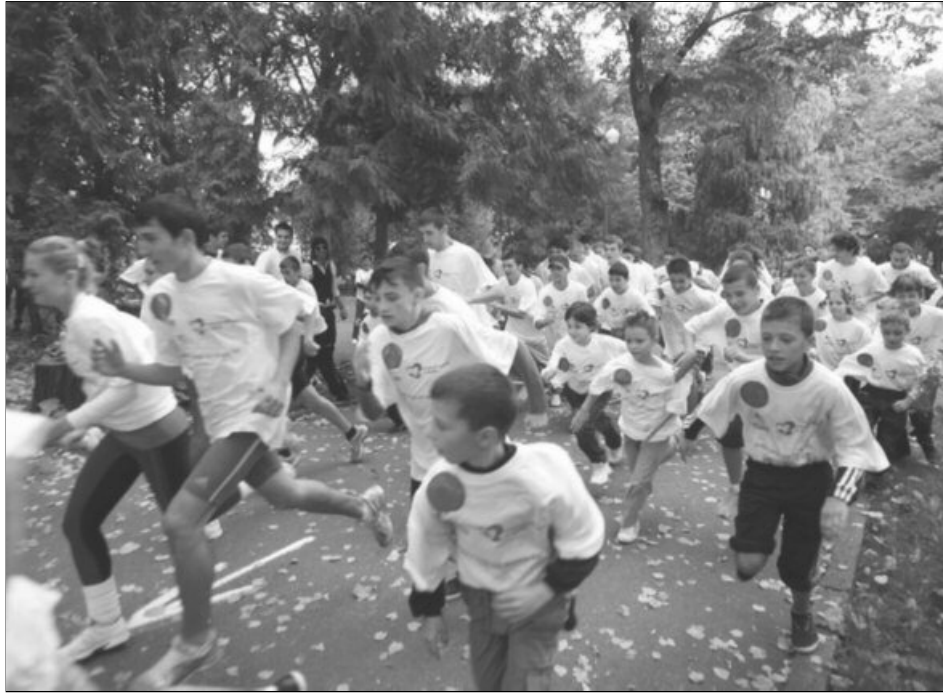
Alergarea ușoară este sănătoasă pentru inimă

Clubul Rotary Brașov, împreună cu Fundația Română a Inimii și Forumul Național de Prevenție, continuă și în 2014 programul „Promenada Inimilor”. Proiectul își propune să încurajeze oamenii să facă mișcare, ca mijloc de prevenție a bolilor cardiovasculare. „Cea de-a doua ediție a acestei sănătoase manifestări va avea loc duminică, 28 septembrie 2014, începând cu orele 10, prin organizarea unui cros la care sunt invitați să participe toți locuitorii orașului, pe traseul realizat anul trecut în Parcul Tractorul. Acest eveniment se naște