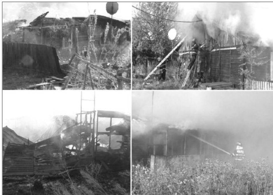
Patru familii din Făgăraș au rămas sub cerul liber după ce casele în care locuiau au fost mistuite de flăcări

Patru autospeciale ale pompierilor au ajuns imediat la fața locului pentru a stinge flăcările mari de de 4-5 metri. „Am intervenit imediat pentru stingerea incendiului. Am întâmpinat probleme pentru că nu am avut de unde să alimentăm autospecialele cu apă.