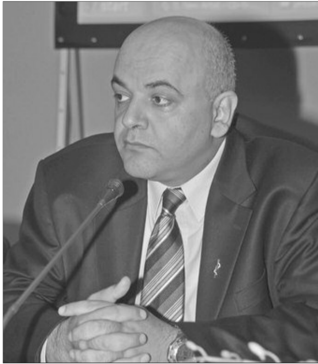
Secretarul de stat Raed Arafat a vorbit de măsurile preventive

„În zonele care sunt supuse riscului seismic, mobilierul și echipamentele trebuie fixate. Întotdeauna am ridicat această problemă. Un spital nu este neapărat să fie funcțional după un cutremur dacă doar ai consolidat clădirea. Dacă echipamentele din spital nu sunt fixate și protejate, acest