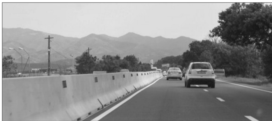
Dacă ar fi existat pe DN 1, un separator de sens ar fi prevenit tragedia

Bucureșteanul mergea pe DN1, spre Ploiești, cu 180 de kilometri la oră. La kilometrul 81 a intrat frontal în mașina