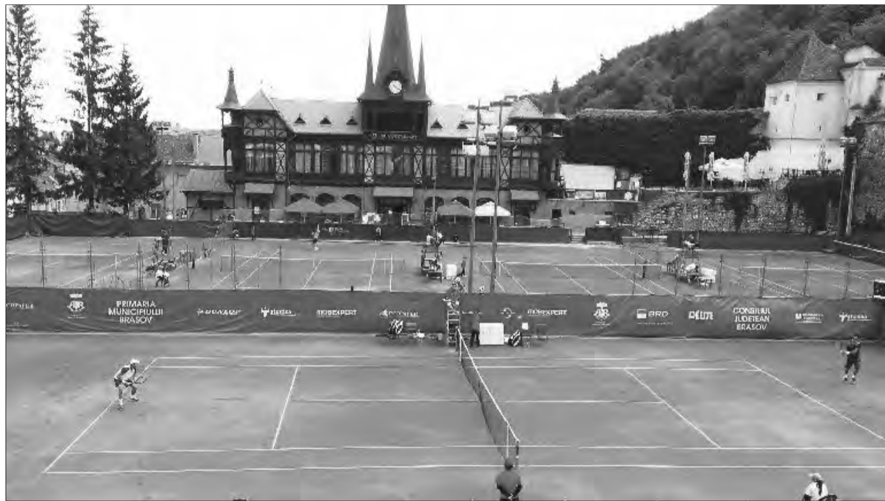
Challengerul de la Brașov atrage și anul acesta nume importante din tenisul mondial